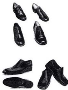
5. รองเท้า คุมส้นสีดำ ทรงสุภาพ ถุงเท้าสีดำ หรือสีสุภาพ

เครื่องแบบ เครื่องหมาย เครื่องแต่งกาย นักศึกษาชาย วิทยาลัยชุมชน แม่ฮ่องสอน