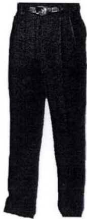
4. กางเกง ขาว สีน้ำเงินกรมท่า หรือดำ แบบและทรงสุภาพ