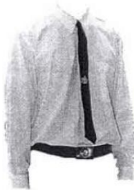
1. เสื้อเชิ้ต แขนยาวสีขาว ผูกเนคไท